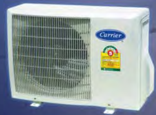
Condensing Unit รุ่น 38HAE024S110