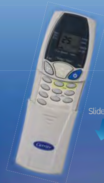
Wireless Remote Control

Cooling Capacity Test Condition Indoor: 27C.db / 19C.wb, Outdoor: 35C. db / 24C.wb Cooling Overloading Test Condition Indoor: 32C.db / 23C.wb, Outdoor: 43C.db / 26C.wb