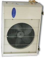
38RE Condensing Unit