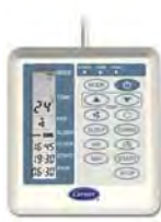
Wire Remote Control