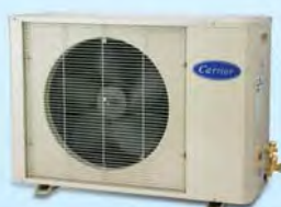
38RE Condensing Unit

Carrier reserves the right to make changes in specifications without prior notice. บริษัทฯ ขอสงวนสิทธิ์ที่จะเปลี่ยนแปลงรายละเอียดข้างต้น โดยมีห้องแจ้งให้ทราบล่วงหน้า