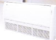
24,000 Btu ~ 48,000 Btu (Ceiling Suspended)