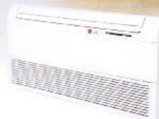
18,000 Btu (Ceiling & Floor)