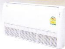
24,000 Btu ~ 40,000 Btu (Ceiling Suspended)