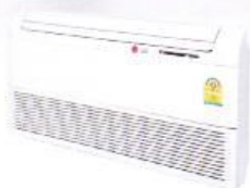
13,000 Btu ~ 19,000 Btu (Ceiling & Floor)

Cooling • Convenience • Easy Installation